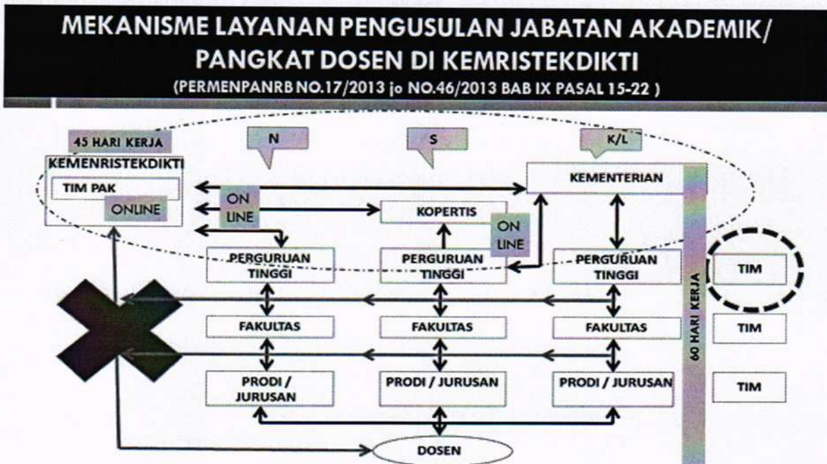
Gambar 1. Mekanisme Layanan Pengusulan Jabatan Akademik/Pangkat Dosen

Kenaikan jabatan akademik/pangkat dosen merupakan bagian tidak terpisahkan dengan pengembangan karir dosen, dengan demikian mekanisme penilaian dan proses kenaikan jabatan akademik/pangkat dosen akan diintegrasikan secara online (daring). Dengan sistem daring diharapkan dapat meningkatkan efisiensi layanan dan mendukung prinsip-prinsip penilaian, sebagaimana pada Gambar 1.